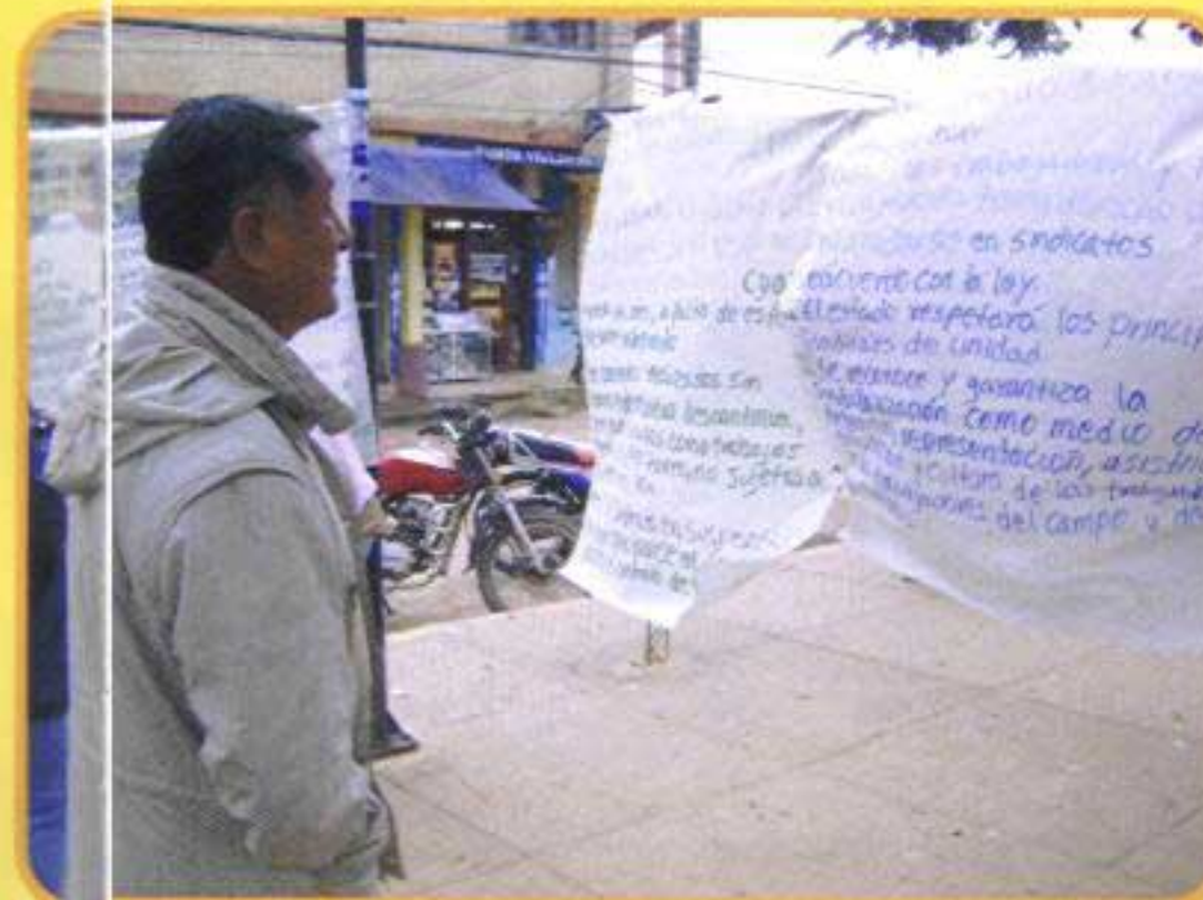
A pesar del "surazo", un empleador se informa sobre nuestros derechos en Trinidad.

Llamó la atención la actitud de algunas autoridades municipales que no autorizaron la instalación de las ferias en ciertas plazas u otros espacios públicos, o que trataron de relegar a las trabajadoras asalariadas del hogar a zonas marginales. A pesar de esa actitud, las