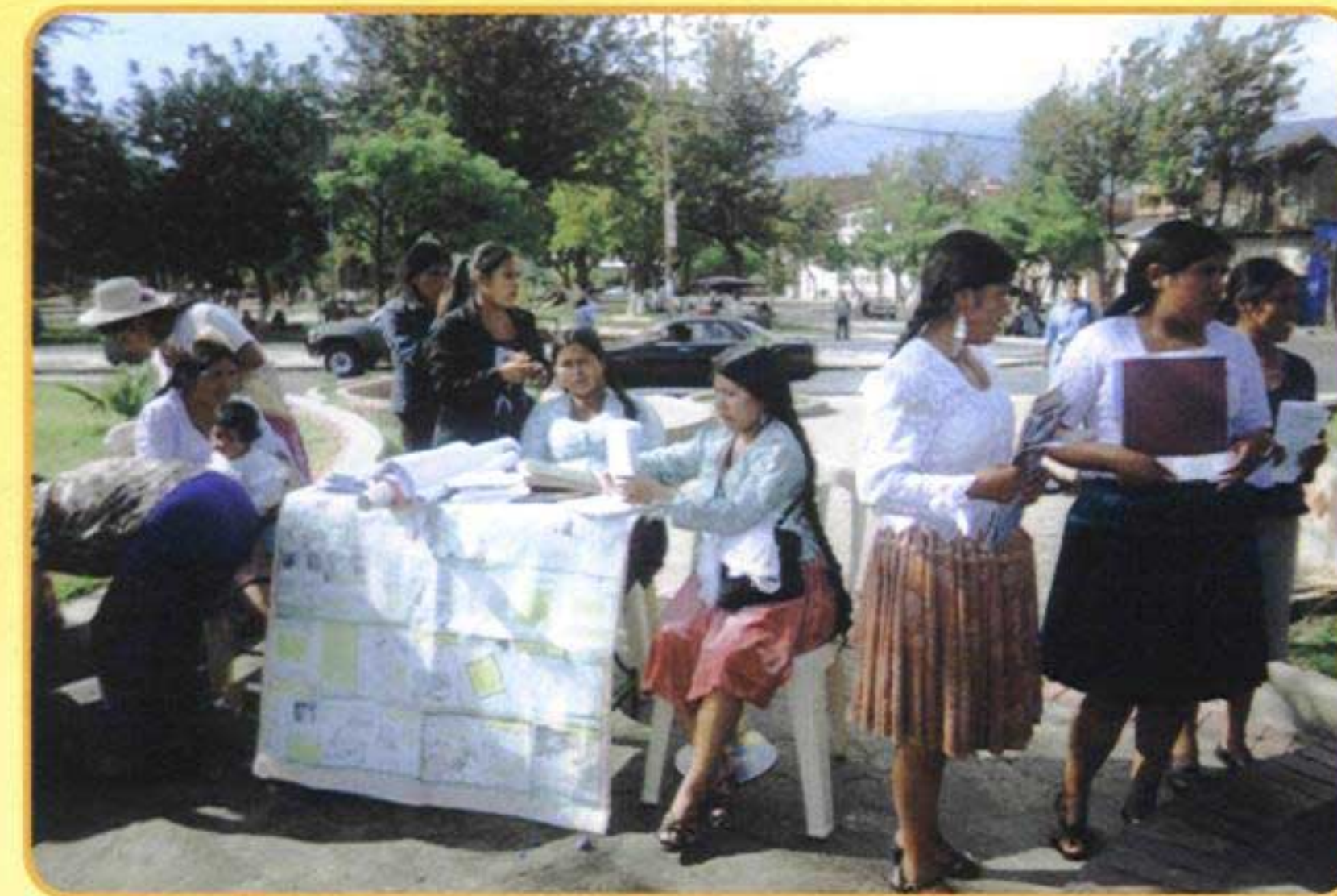
Las compañeras del sindicato Cochabamba, participan activamente en la feria de marzo.