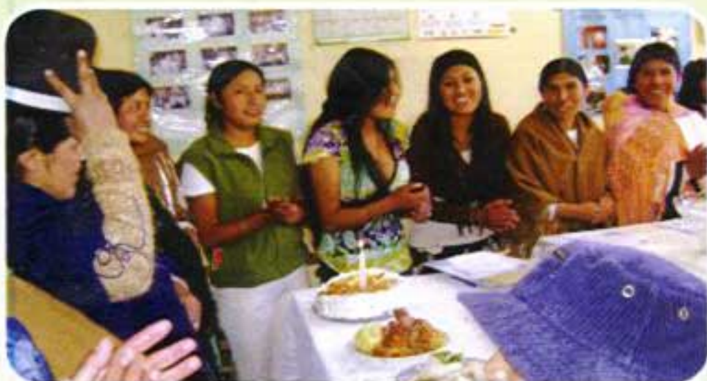
Mucha amistad y compañerismo en el aniversario del sindicato Zona Sur.

este instrumento estarán representadas legalmente, tendrán la protección del Estado y podrán ahora acceder a otros beneficios.