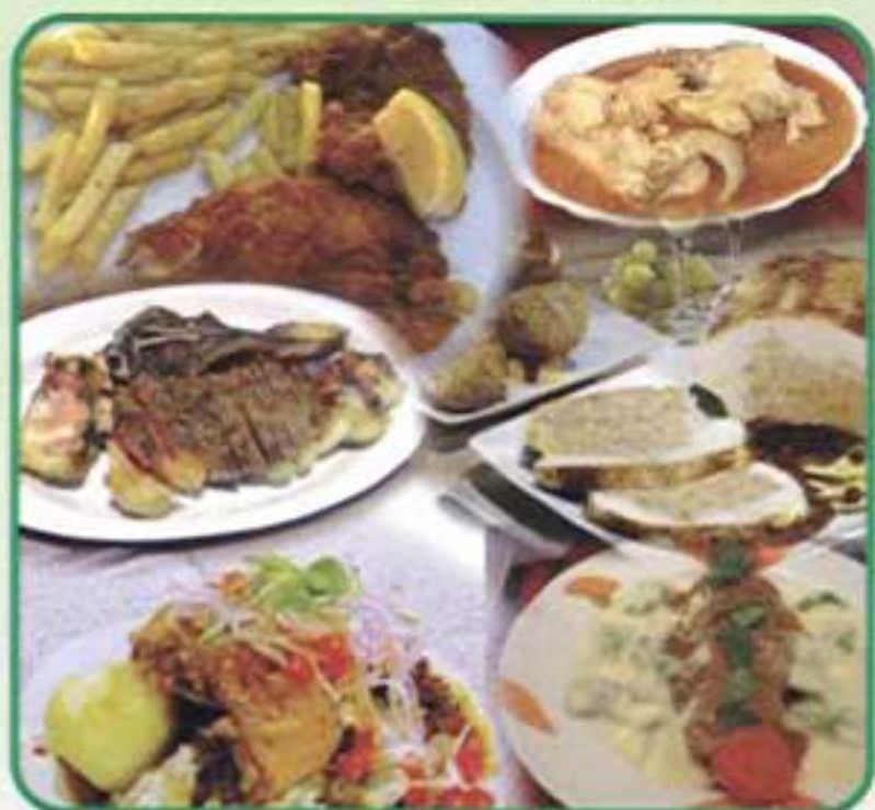
Las compañeras mejoran sus capacidades de trabajo en el hogar

Los cursos se realizan en el Centro de Formación Integral de la Mujer (CEFIM). Cada uno de los módulos incluye 14 sesiones de trabajo, cada una de 3 horas de duración. Las clases de cocina se realizan los días miércoles por la noche y las de administración del hogar y atención de terceros, los sábados por la tarde.